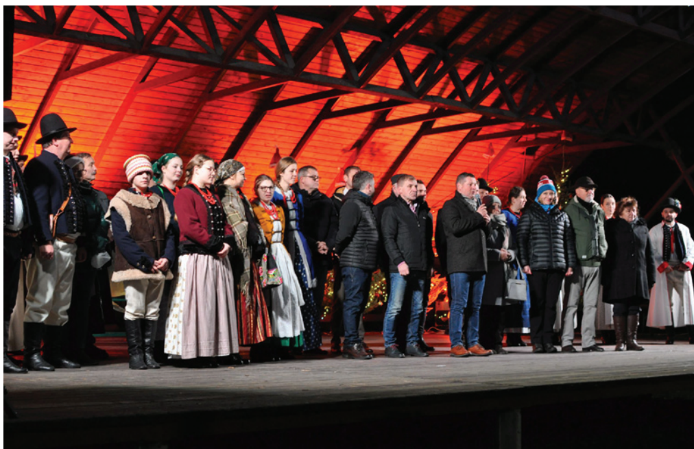
Życzenia dla mieszkańców

Na estradzie i poza nią działo się mnóstwo ciekawych rzeczy. Wykonawcy postawili głównie na repertuar kołędowy i świąteczny. Kolejno wystąpili: Kapela góralska „Zbójnicy” ze Szczyrku, Orkiestra Dęta Gminy Bestwina z siedzibą w Kaniowie, chór szkolny SP Kaniów „Divertimento” i zespół fletowy, artyści z Domu Kultury w Komorowicach oraz świętujący 50-lecie istnienia Regionalny Zespół Pieśni i Tańca „Bestwina” . Wieczorem przyszedł czas na teatr ognia , show z wykorzystaniem płonących elementów i efektów pirotechnicznych. Najmłodszy chętnie sфотографowali się z Myszką Miki, bałwankiem Olafem i samym Świętym Mikołajem, zaś zwoleńnicy wrażeń gastronomicznych częstowali się darmową zupą rybną i karpriu ze stoiska stowarzyszenia „ Kaniowski Karp Królewski ”. Szczególny entuzjazm uczestników pikniku wzbudziły psie zaprzęgi .