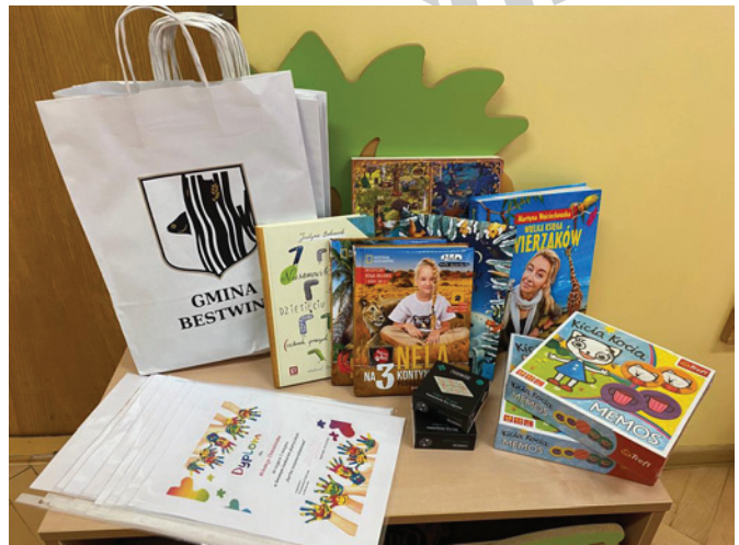
Nagrody dla laureatów