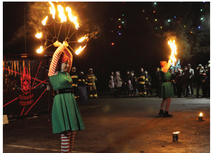
Widowiskowy teatr ognia