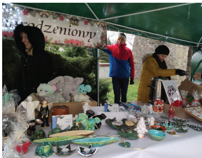
Organizatorzy przygotowali ciekawe wyroby rękodzielnicze