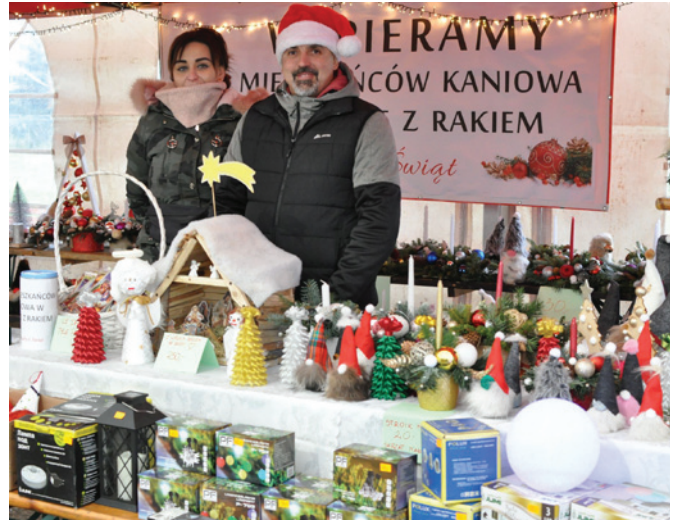
Jedno z charytatywnych stoisk