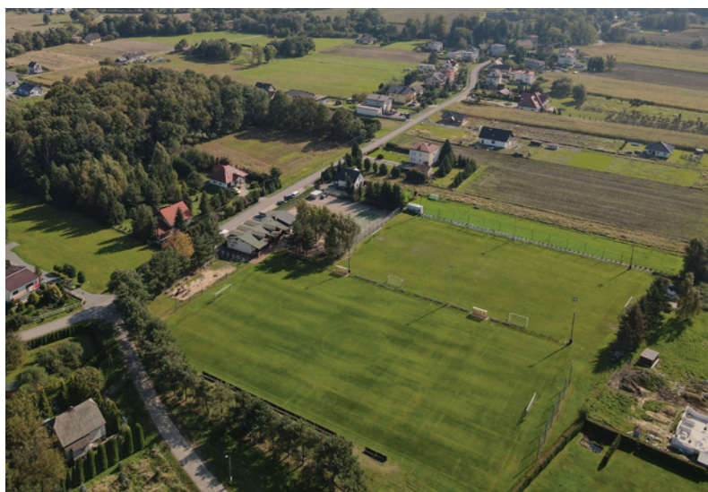
Kompleks sportowy KS Bestwinka

społecznej pracy działacze wraz z gronem sympatyków przy finansowym wsparciu sponsorów oraz Urzędu Gminy drobnymi krokami ciągle ulepszają infrastrukturę naszego obiektu. W tym