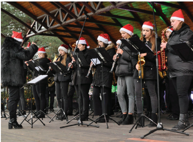
Występ Orkiestry Dętej Gminy Bestwina z siedzibą w Kaniowie