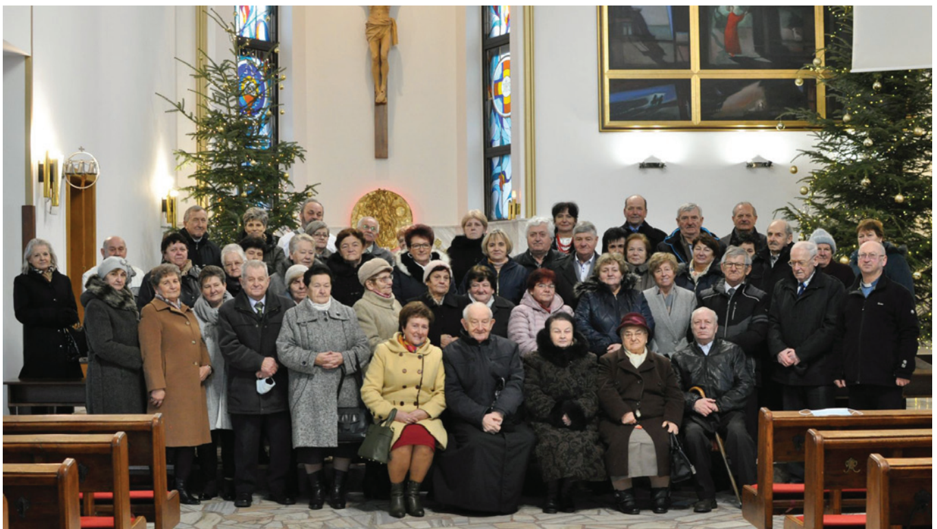
Uczestnicy jubileuszowych uroczystości